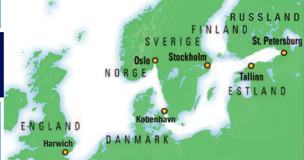
St. Petersburg, Russland

Vil du heller bli igjen om bord tilbyr Jewel of the Seas 13 dekk med bl.a. spa- og skjønnhetsavdeling, treningsenter, klatrevegg, butikker, kunst, teater, kino og ikke mindre enn seks restauranter og kaféer, ti barer, et kasino, to basseng og tre boblebad som bidrar til en fantastisk cruiseopplevelse.